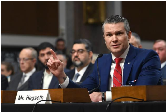
국방장관 지명자 피트 헤그세스는 1월 14일 상원 군사위원회 청문회에서 발언하고 있다

계질서는 무용할뿐만 아니라 미국을 향해 쓰여지는 무기가 되었다고 진단했다. 3 또한 외교정책에 있어 신중함은 미국의 가치를 버리는 것이 아니라 미국이 지구상의 가장 부유하고 막강할지라도 그 부와 힘이 무제한이 아님을 인식하는 것이며 국익을 최우선으로 하는 것이 고립주의가 아니라고 밝혔다.