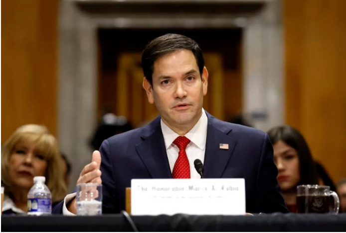
국무장관 지명자 마코 루비오 상원 의원은 1월 15일 상원 외교위원회 청문회에서 증언하고 있다

미 상원 국방위원회는 2025.1.14, 피트 헤그세스 (Peter B. Hegseth) 국방장관 지명자 인사청문회를, 미 상원 외교위원회는 2025.1.15, 마코 루비오 (Marco A. Rubio) 국무장관 지명자의 인사 청문회를 실시했다. 미 상원은 2025.1.20, 트럼프 대통령 취임 당일 마코 루비오 국무장관 지명자의 인준안을 만장일치(99:0)로 가결했다. 루비오 국무장관은 트럼프 내각 중 상원 인준을 첫번째로 통과했다. 반면 미 상원은 2025.1.24, 피트 헤그세스 국방장관 지명자의 인준안을 가까스로 통과시켰다. 공화당 53; 민주당 47로 의석이 분배된 미 상원에서 공화당 소속 리사 머코스키 (알래스카), 수전 콜린스 (메인), 미치 매코널 (켄터키) 세 명의 상원의원이 헤그세스 국방장관 지명자 인준안